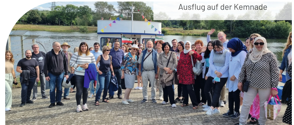
Ausflug auf der Kemnade

Sie wünschen sich eine Veranstaltung zu einem bestimmten Thema? Im Rahmen von „Bildung auf Bestellung“ können Sie uns jederzeit Qualifizierungs- und Informationsbedarfe melden: vielfalt@en-kreis.de .