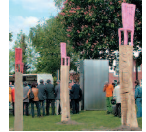
EN-Kunst 2004, Stadtgarten Gevelsberg

an den frühen Bergbau im Ruhrtal. Beide sind heute Denkmale und Museen der Industriekultur. Die Henrichshütte profiliert sich zudem als Veranstaltungsort für Kulturevents.