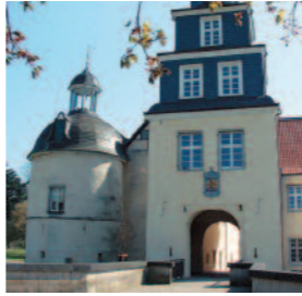
Museum Haus Martfeld, Schwelm

Mit großer Überzeugung unterstützt der Ennepe-Ruhr-Kreis die Bewerbung der Stadt Essen für das Ruhrgebiet als Kulturhauptstadt Europas 2010.