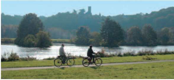
Ruhrtal vor Burg Blankenstein