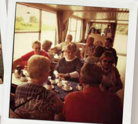
Ausflug MS Kemnade

Arbeitsweise. Wir werden uns bemühen, den Ansprüchen und Erfordernissen gerecht zu werden. Seit längerer Zeit gehören - mit einigen Auf- und Abs - 40 Mitglieder zur Selbsthilfegruppe. Es wäre schön, wenn auch jüngere Schlafapnoeiker den Weg zu uns fänden und in der Gruppe mitarbeiten. Natürlich sind wir uns darüber bewusst, dass sich viele Jüngere ihre Informationen eher aus dem Internet holen, als auf die Erfahrungen der „alten Hasen“ zu bauen. Aber vielleicht können wir ja den einen oder anderen von unserer ehrenamtlichen Arbeit überzeugen.