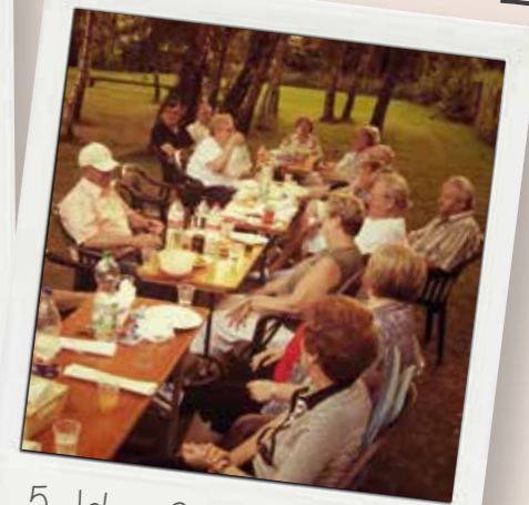
5 Jahre Selbsthilfegruppe