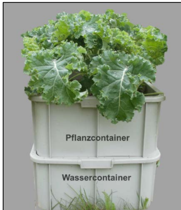
Abbildung 2: Grünkohlexpositionsverfahren

Es wurde ein Container aufgestellt, der mit einem Einheitserde-Sand-Gemisch (ED 73) gefüllt und durch Textildochte mit einer automatischen Wasserversorgung verbunden war (s. Abbildung 2). Bei der Grünkohlexposition wurden pro Container 5 Pflanzen ausgebracht. Die Pflanzen wurden nach 84 Tagen Expositionszeit geerntet und in Aluminiumboxen gekühlt zur Fa. Münster Analytical Solutions (mas) transportiert. Bei der Ernte wurden nur verzehrfähige Blätter entnommen. Im Labor erfolgte die küchenfertige Aufarbeitung der Proben zu einer homogenen Mischprobe je Messpunkt. Das Pflanzenmaterial wurde gründlich gewaschen, schockgefroren und anschließend gefriergetrocknet. Nach dem Vermahlen wurden die Gehalte an PCDD/F, dl-PCB, der 6 Indikator-PCB 28, 52, 101, 138, 153 und 180 sowie der PCB-Kongenere 47, 51 und 68 ermittelt.