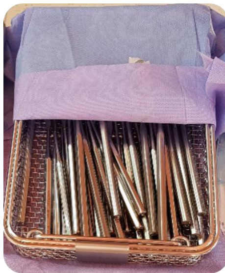
Set mit sauberen Mundspiegeln: Die Spiegelköpfe sind immer abgedeckt.

Die Mundspiegel sind gereinigt und von allen Keimen befreit. Zum Schutz vor äußerlicher Verschmutzung sind die Mundspiegel-Sets in Folie eingeschweißt. Sie sind steril .